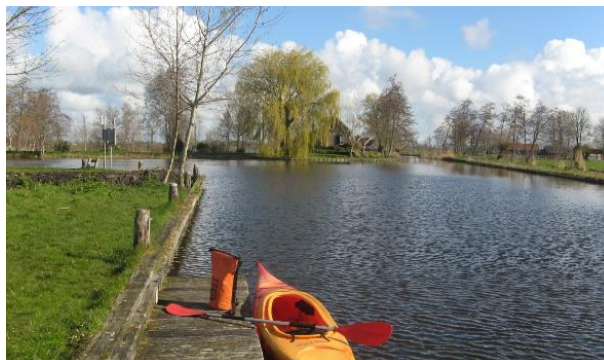
Startpunt bij TOP Heinoomsvaart

Na een paar honderd meter zie je links een kanosteiger. Ga hier het water uit.