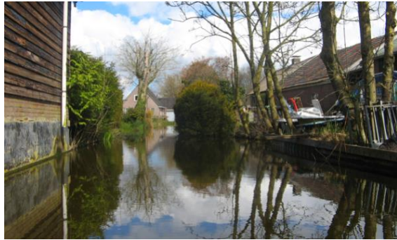
Aankomst in Wilnis