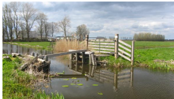
Ernstig vervallen houten brug, langs de Gagelweg