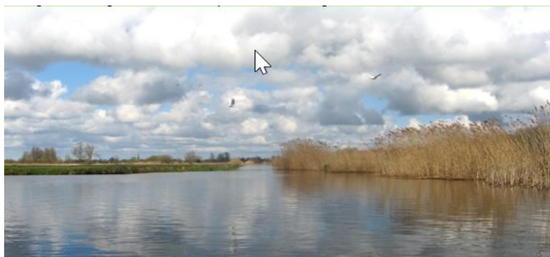
Natuurgebied de Gagel

https://www.rtvutrecht.nl/nieuws/1924795/natuurlijk-zo-y-legakkers-blijven-natuurlijk-behouden.html