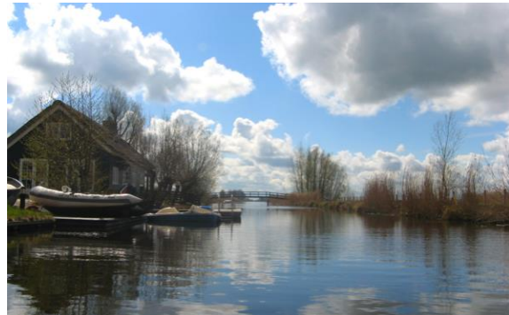
Bijleveld vanaf Wilnis