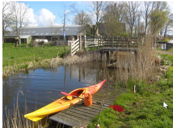
Instappunt bij de Gagelweg

Ga net voor of net na de volgende houten na de vervallen brug naar links. Beide wegen brengen je naar het natuurgebied De Gagel.