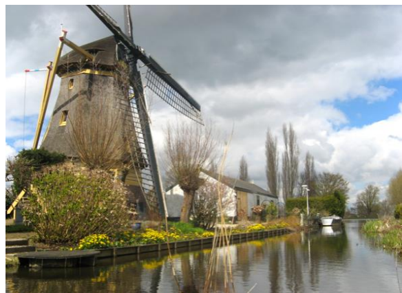
Veenmolen uit 1823